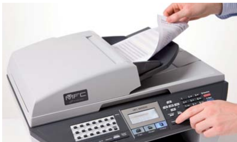
Automatisk dokumentføder – perfekt til fax*, kopi eller scan af flersidede dokumenter