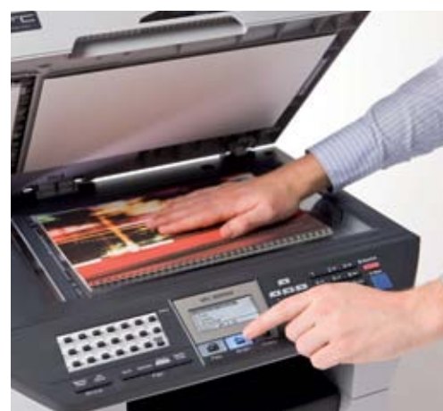
Scan dine A4-dokumenter i farver

Her får du virkelig noget for pengene: Tre energieffektive arbejdsheste, som hjælper dig med at skære ned på forbruget med automatisk duplexprint, -fax*, -kopi og -scan. Desuden fås ekstra stor toner, som gør sideprisen lavere.